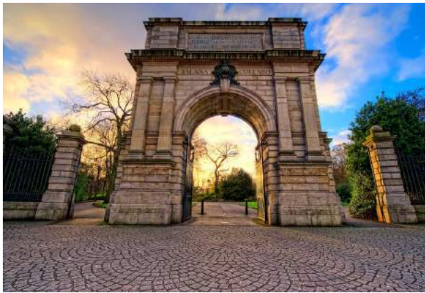
St. Stephen's Green Park