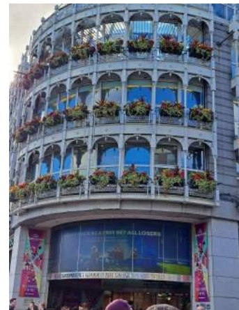
St. Stephen's Green Shopping mall

A következő napokon mindig más és más szépséget, nevezetességet, érdekes múzeumot látogattunk meg.