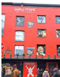
The Wall of Fame (Temple District)

A nyelviskolai órákon kívül nagyon színes programokkal láttak el bennünket a Babel Academy munkatársai. Ennek nyitásaként egy idegenvezető kíséretében egy 2 órás városnézésen vettünk részt, melynek keretében a legfontosabb útvonalakat, leghíresebb nevezetességeket, parkokat mutatták be nekünk, ezzel is ízelítőt adva a felfedezésre váró helyekről. Íme, néhány szép és izgalmas hely képekben: