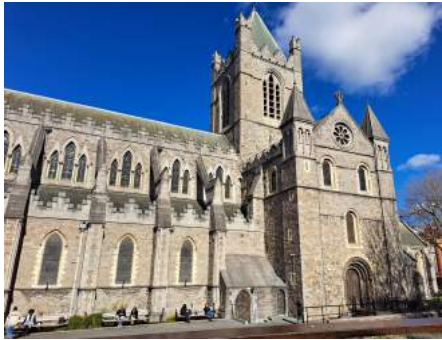
Christ Church Cathedral