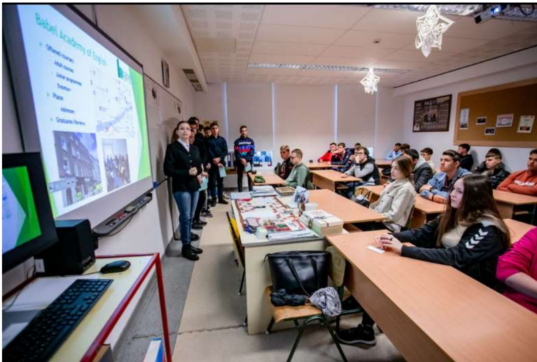
Előadás a Fenntarthatósági témahéten

A KA 122-SCH számú Erasmus+ program keretében lehetőségünk nyílt 2023. március 5-12 között részt venni Dublinban a Babel Academy of English Nyelviskolában egy 1 hetes kurzuson. A nyelvi fejlesztésen felül a kurzus témája a környezettudatosság és fenntarthatóság volt. Hazaérkezve a Dublinban tanult, tapasztalt ismeretekről beszámoltunk osztályunknak, illetve a Fenntarthatósági témahét keretében iskolánk diákjainak, valamint ökológiai lábnyomuk számítását, környezetvédelemmel kapcsolatos totó kitöltését és plakátok készítését végeztük közösen.