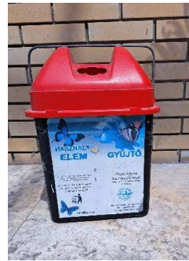
Elemgyűjtésre szolgáló kukák

Terveink között szerepel a következő tanévtől, minden hónapban más környezeti problémára felhívni a tanulók figyelmét az iskola honlapján közzétett videók, ismeretterjesztő cikkeken keresztül, melyeket, akár tanórán is fel lehetne dolgozni.