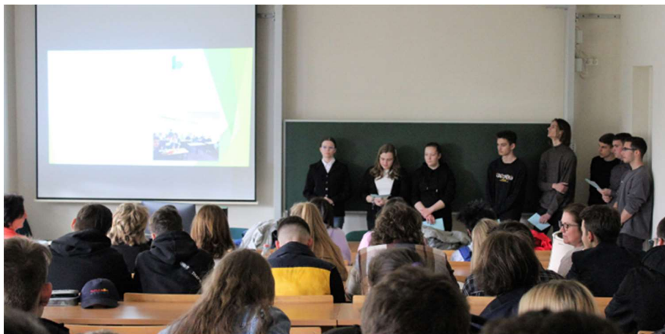
2023. április 26. International Club

A Dunaújvárosi Egyetem Nemzetközi Klubjában angol nyelven előadást tartottunk kinn tartózkodásunkról, illetve a környezettudatosságról.